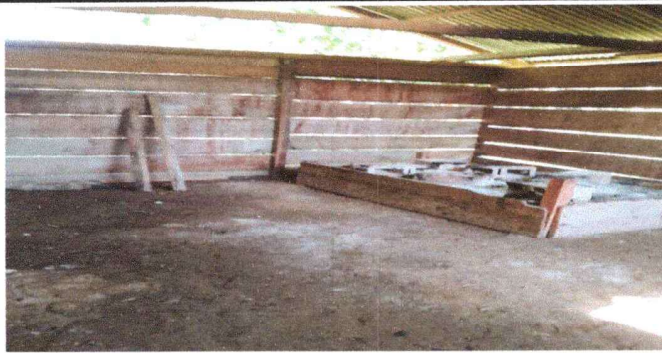
Foto1: Se observa en el interior donde se va sustituir el piso y polleton.