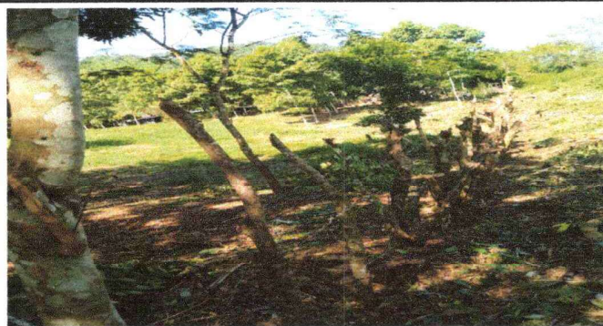
Foto 3: Se observa observa la circulacion del predio de la escuela en mal estado sustituir las mallas y poner postes de tubos metalicos galvanizada.