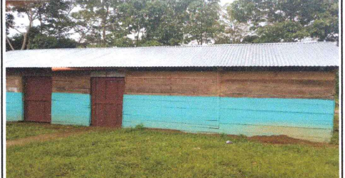
Foto 2: Se observa desde el exterior de la direccion y bodega donde se va entechar el corredor.