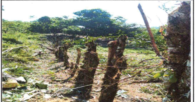
Foto 4: Se observa desde otro angulo de vista del predio de la escuela cambiar la malla y poner un portón de metal.